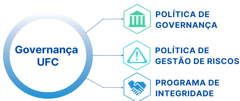
Figura 2 - Frentes de ação da Governança da UFC

As áreas de atuação da Governança da UFC foram utilizadas como referência para estruturar internamente a SECGOV, propiciando melhor gerenciamento das ações de implementação e de monitoramento da Política de Governança, da Política de Gestão de Riscos e do Programa de Integridade, conforme apresentado na figura 2 . Destaque-se que, apesar de não haver formalmente essa divisão de setores na SECGOV, a referida estrutura tem sido praticada exclusivamente de modo a viabilizar a dinâmica dos trabalhos nessas três frentes de atuação, além da secretaria executiva.